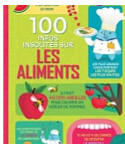
100 infos insolites sur les aliments , Collectif. Usborne, 2017. (Encyclopédie)