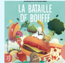
La bataille de bouffe