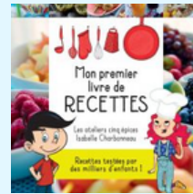
Mon premier livre de recettes