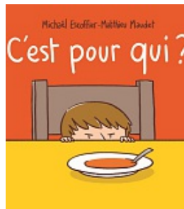
C'est pour qui? , Escoffier, M. L'école des loisirs, Coll. Loulou & cie, 2018.