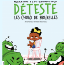
Albertine Petit-Brindamour déteste les choux de Bruxelles