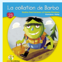
La collation de Barbo Aut: N. Descheneaux (Mini-Rat, Livret 23)