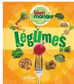
Légumes , Parker, Vic. Scholastic, Coll. Bien manger, 2016. (D'autres titres dans cette collection)