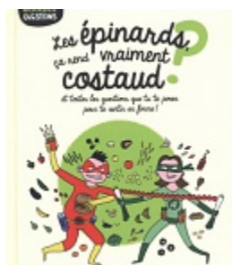
Les épinards, ça rend vraiment costaud? , Guerri, Auréli. Fleurus, Coll. Petites et grandes questions, 2017.