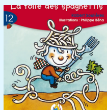
La folie des spaghettis Aut: R. Soulières (Série rouge, Livret 12)