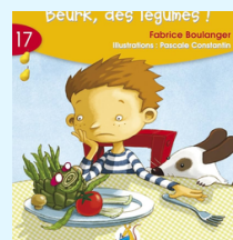
Beurk, des légumes ! Aut: F. Boulanger (Série jaune, Livret 17)