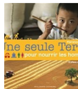
Une seule Terre pour nourrir les hommes , Thinard, Florence. Gallimard jeunesse, Collection Demain, le monde, 2015.