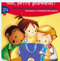
Non, petits gourmands! Aut: N. Descheneaux (Série rouge, livret 24)