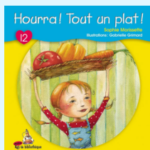
Hourra! Tout un plat! Aut: S. Morissette (Mini-Rat, Livret 12)