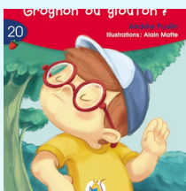
Grognon ou glouton ? Aut: A. Poulin (Série rouge, Livret 20)