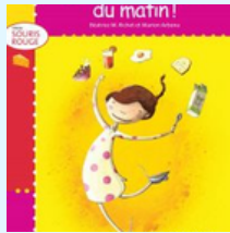
J'adore le repas du matin !)