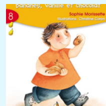
Bananes, vanille et chocolat (Série jaune, Livrets 8)