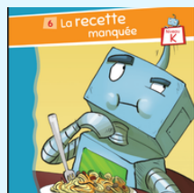
La recette manquée