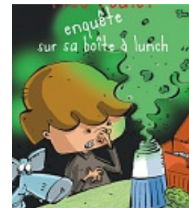
Fred Poulet enquête sur sa boîte à lunch , Tremblay, Carole. Dominique et compagnie, Coll. Mon premier roman en couleur, 2018.