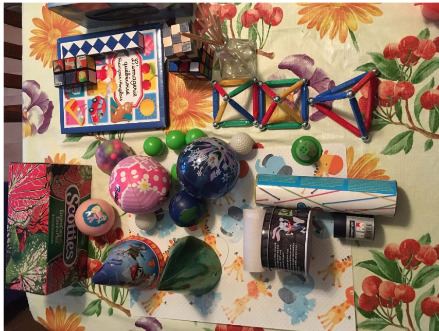
Exemples d'objets récupérés par des enfants de 1 re année

Exemples d'objets : bibelot d'une pyramide maya, module de parc